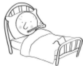
Stay home when sick

Ask your doctor for the flu vaccine today!