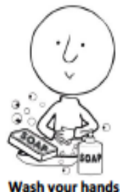
Wash your hands