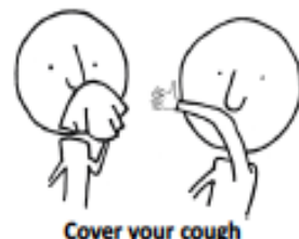
Cover your cough