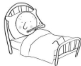
Stay home when sick

Ask your doctor for the flu vaccine today!