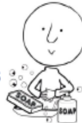
Lávese las manos