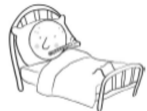
Quédese en casa si está enfermo

¡Pregúntele a su doctor sobre la vacuna contra la gripe!